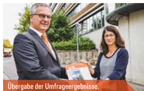
Übergabe der Umfrageergebnisse.