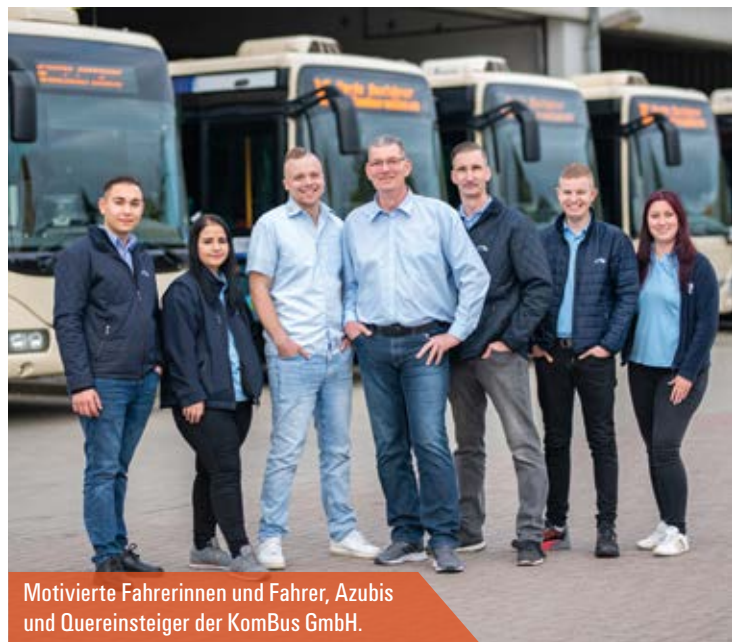
Motivierte Fahrerinnen und Fahrer, Azubis und Quereinsteiger der KomBus GmbH.

Der Wartburgkreis gründete im Jahr 2020 eine Behördenfahrschule, die vom Verkehrsunternehmen Wartburgmobil betrieben