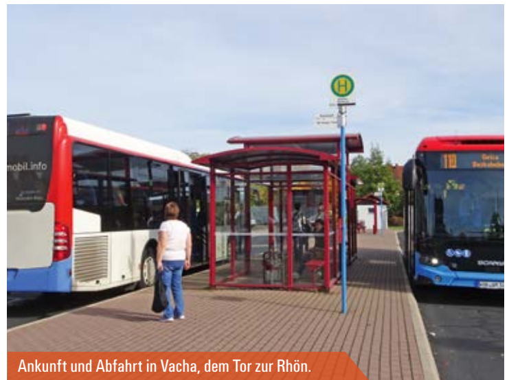
Ankunft und Abfahrt in Vacha, dem Tor zur Rhön.

» Der Problem- und Handlungsdruck ist sehr hoch. «