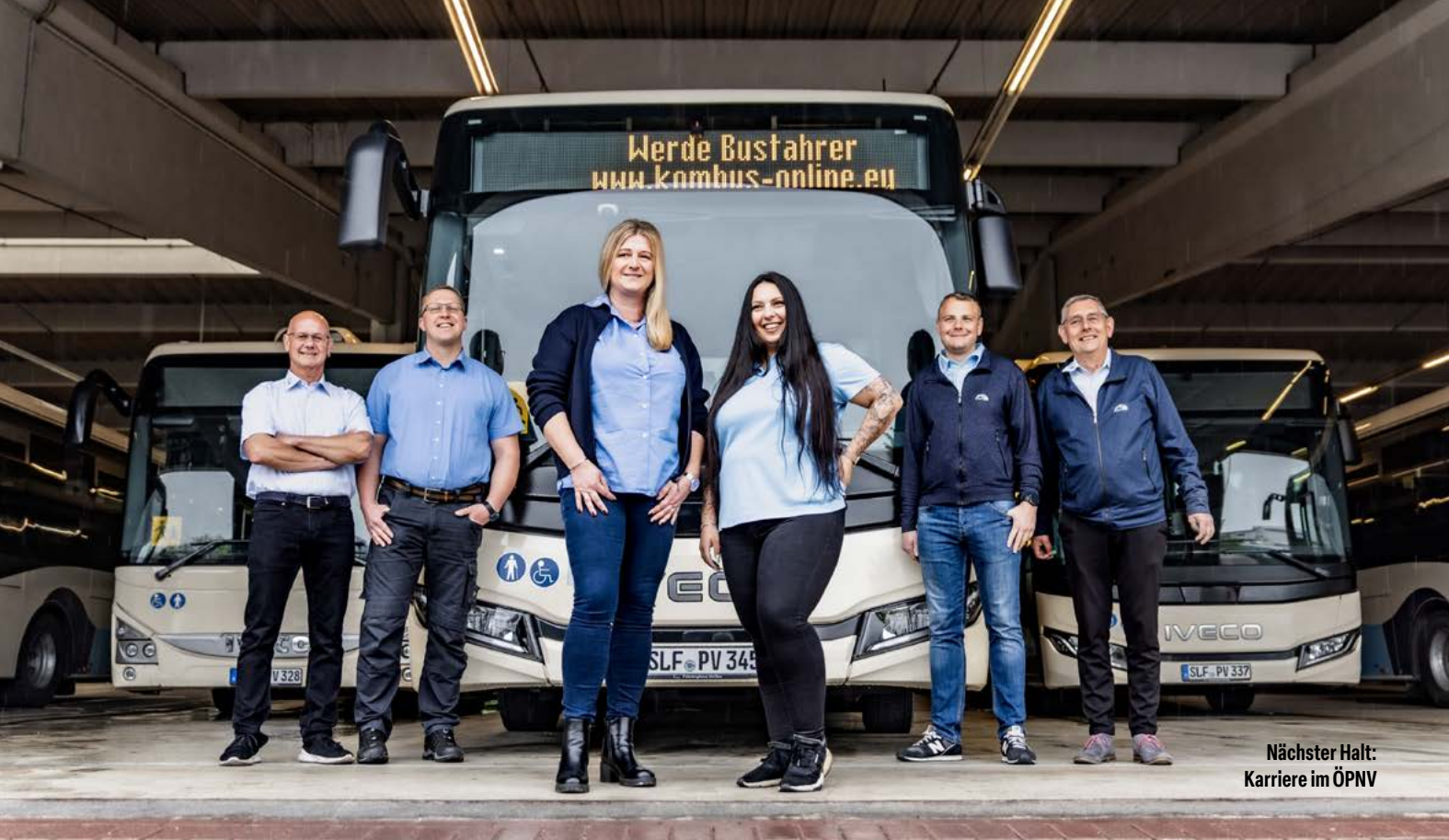
Nächster Halt: Karriere im ÖPNV